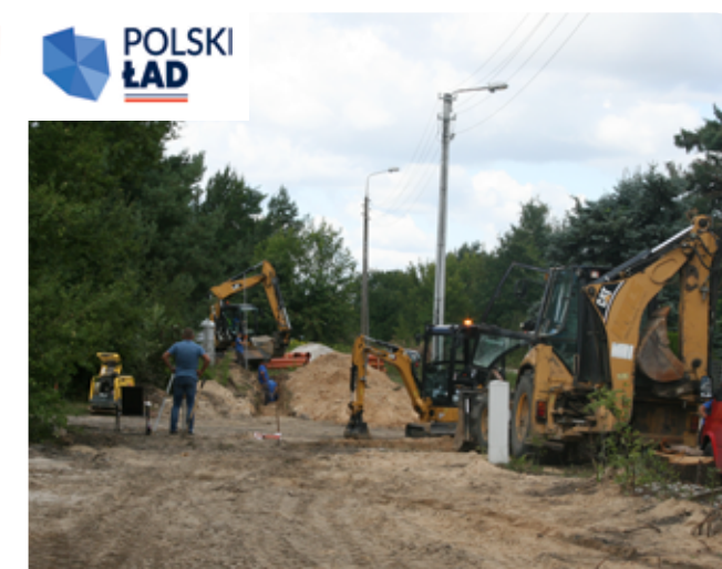
Uliczka boczna od ulicy Niwka Stara