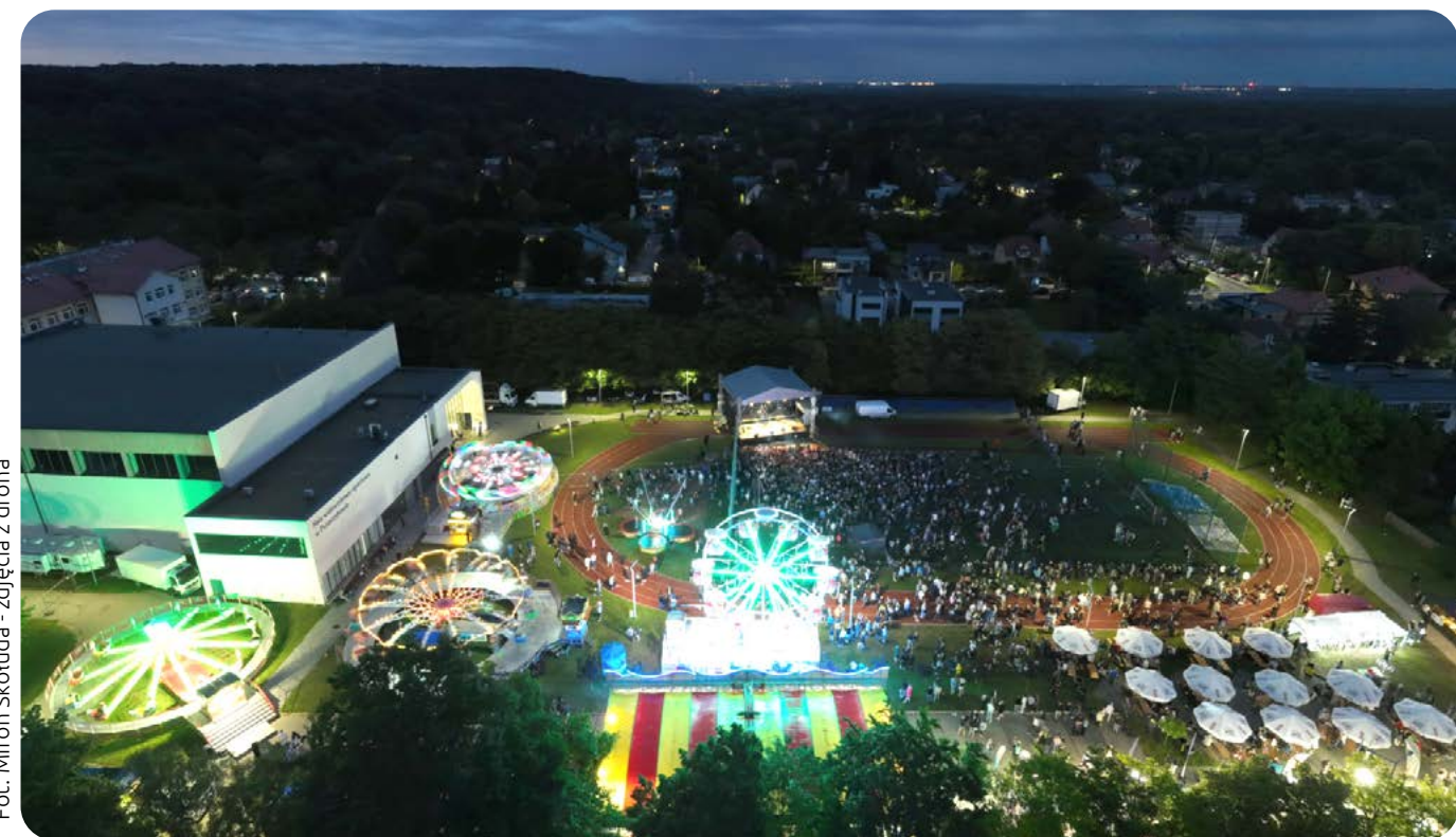
Fot. Miron Skotuda - zdjęcia z drona