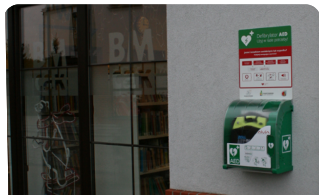
montaż automatycznych defibrylatorów AED