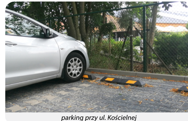
parking przy ul. Kościelnej