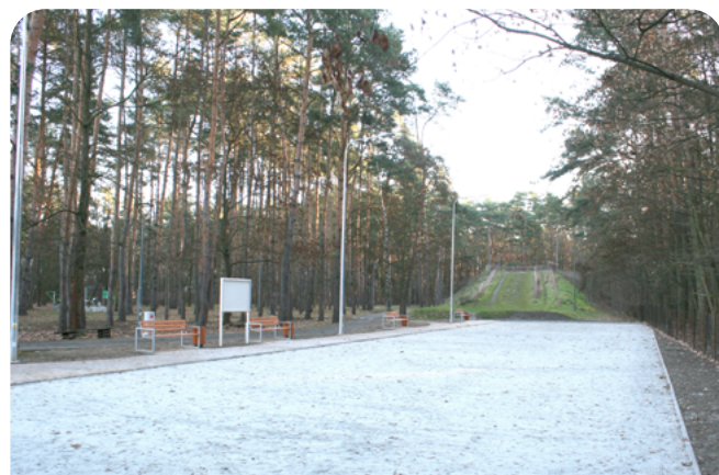
rozbudowa boiska do gry w młkky i boule