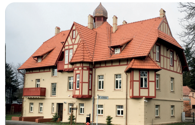
rewitalizacja willi Mimozy