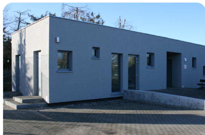
budowa budynku szatni na boisku Orlik Nowe Osiedle