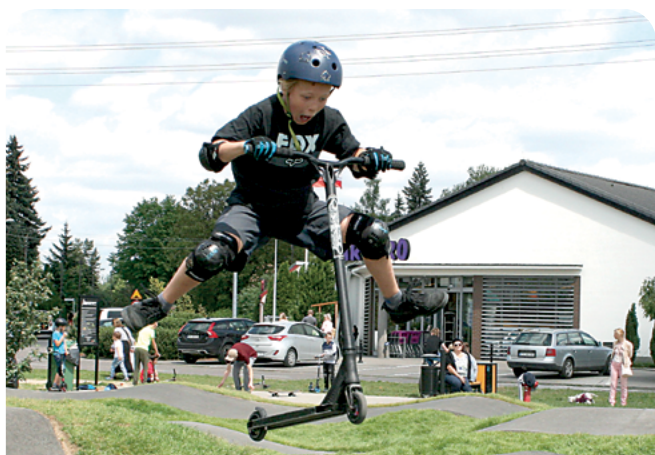
budowa pumtracka przy ul. Nowe Osiedle