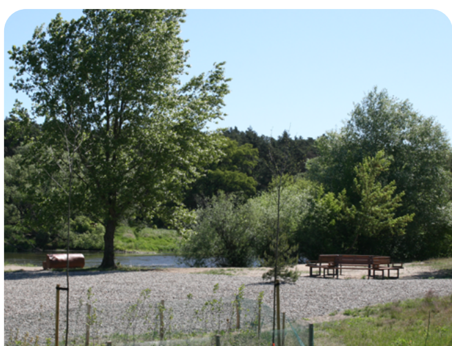
zagospodarowanie Zakola Warty