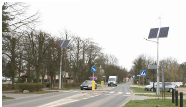
przejście dla pieszych z azylem (ul. Nadwarciańska)