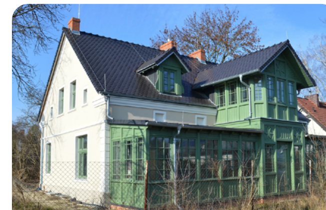
remont willi Eugenii