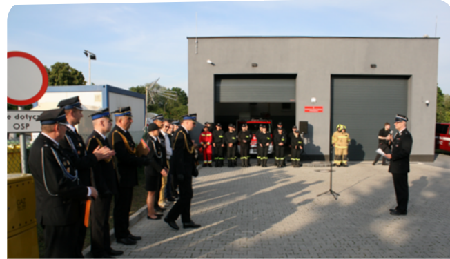
otwarcie remizy strażackiej OSP