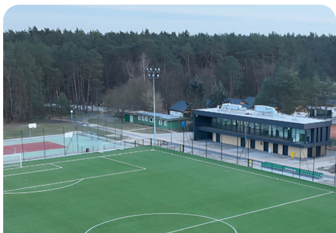
boisko wielofunkcyjne na terenie dawnego MOSIR