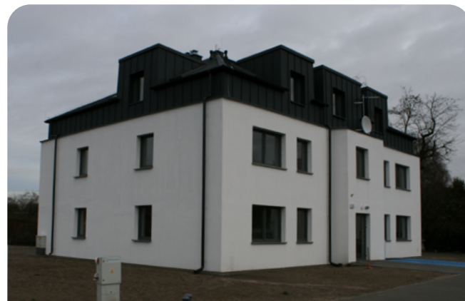
budowa budynku komunalnego