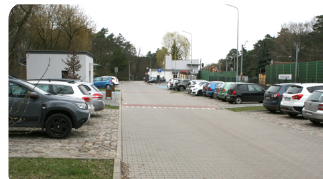
Zintegrowany Węzeł Przesiadkowy