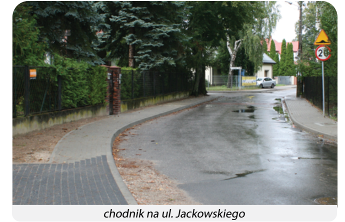
chodnik na ul. Jackowskiego