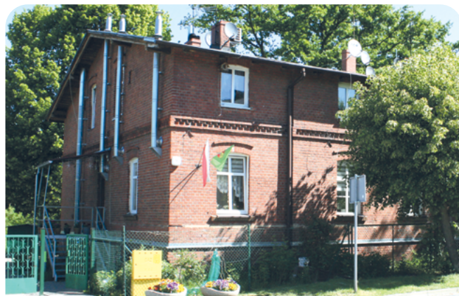
termomodernizacja budynku przy ul. Poznańskiej 4