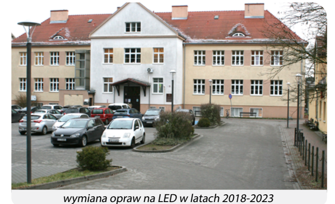
wymiana opraw na LED w latach 2018-2023