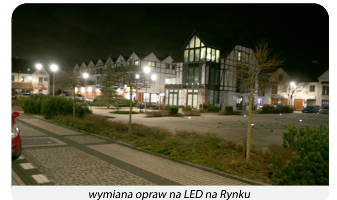
wymiana opraw na LED na Rynku