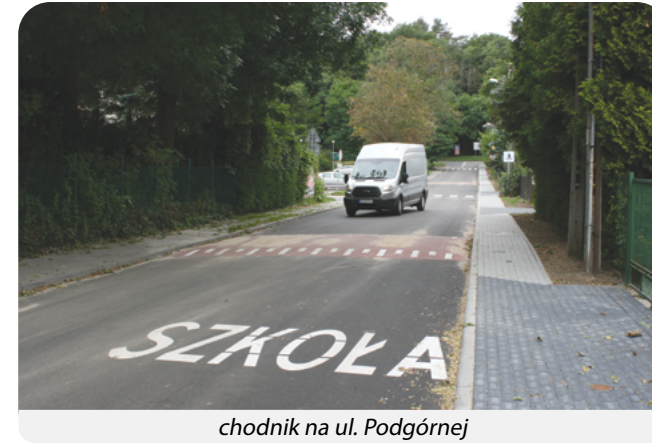
chodnik na ul. Podgórnjej