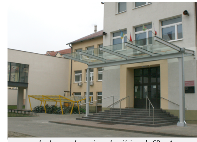
budowa zadaszenia nad wejściem do SP nr 1