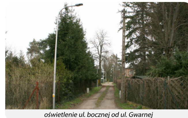
oświetlenie ul. bocznej od ul. Gwarnej