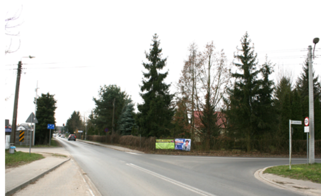
budowa monitoringu wizyjnego - ul. Nadwarciańska