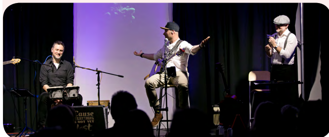
Fot. Ala Brączkowska