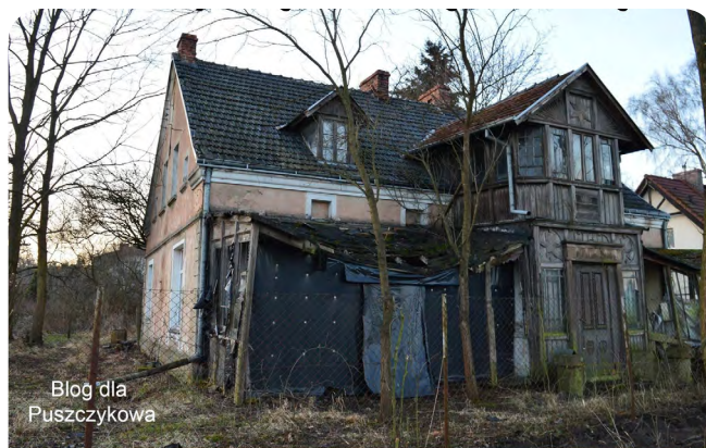
Błóg dla Puszczykowa