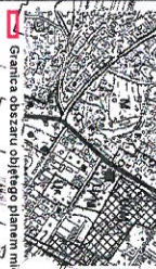
Wyrys z Studium uwarunkowań i kierunków zagospodarowania przestrzennego Miasta Puszczykowie