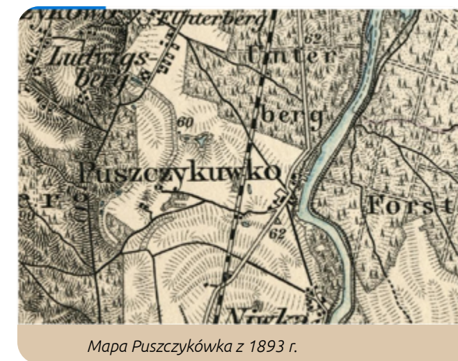
Mapa Puszczykówka z 1893 r.