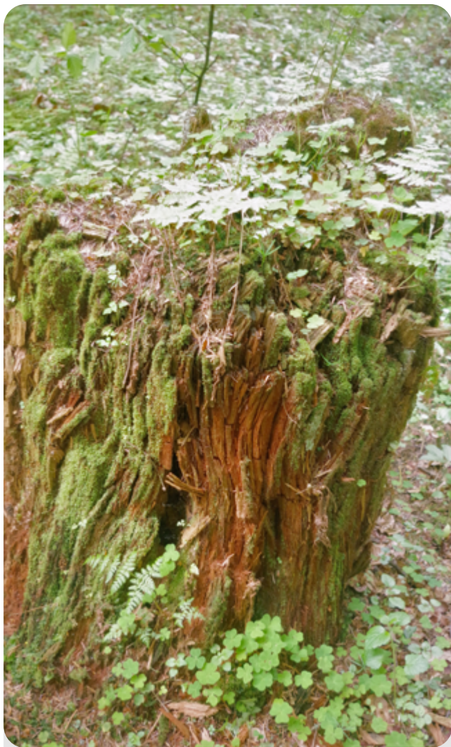
Życie po życiu