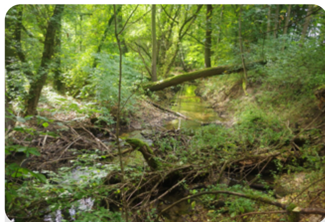
Tarasowanie cieków przez zwalone drzewa powoduje powstawanie „koryt ulgi” i rozlewisk