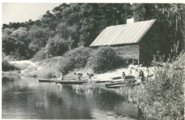
Puszczykovo - Turystyczny dom