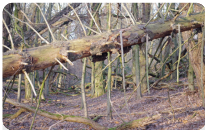
Naturalne zasieki ograniczające możliwość wejścia do wnętrza lasu i zgryzania kolejnych pokoleń drzew przez duże ssaki roślinożerne

Martwe drewno magazynuje również bardzo duże ilości wody, która pochodzi z procesów rozkładu, jak i opadów atmosferycznych. W ten sposób staje się rezerwuarem wody dla lasu a jednocześnie ma wpływ na łagodzenie mikroklimatu. Młode siewki wyrastają nierzadko na pniach czy kłodach, znajdując w nich odpowiednią ilość wilgoci oraz niezbędne pierwiastki. W ten sposób nowe pokolenia drzew wyrastają na rozkładających się szczątkach swoich przodków. Wpływ martwego drewna na stosunki wodne przejawia się nie tylko w jej magazynowaniu, ale również w bezpośrednim oddziaływaniu np. na cieki. Zwalone w poprzek biegu wody drzewa potrafią wyhamowywać nurt, blokować koryta poszerzając je, tworząc rozlewiska czy też wymuszać „koryta ulgi”, kiedy woda omija przeszkodę. Tworzą się w ten sposób bardzo ciekawe siedliska o zróżnicowanych warunkach, zarówno, jeśli idzie o głębokość, charakter dna, prędkość nurtu. Wzrasta w ten sposób również różnorodność organizmów, które je zamieszkują. Kłody tarasujące nurty spiętrzają wodę, zatrzymując ją w lesie, a jednocześnie przeciwdziałają gwałtownym spływom do rzek po ulewnych deszczach.