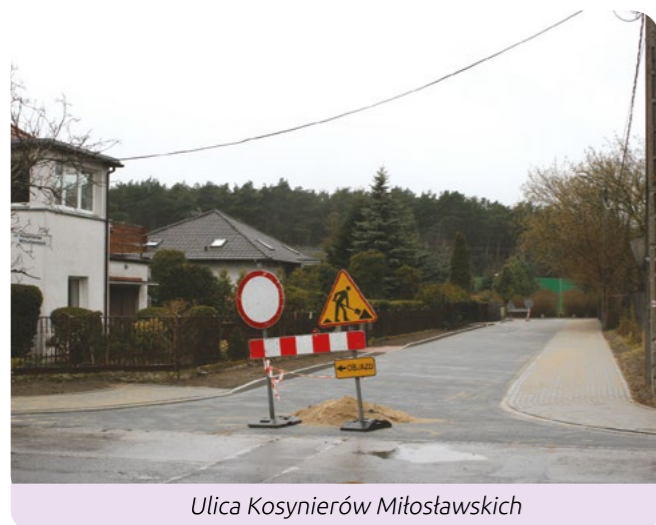
Ulica Kosynierów Miłosławskich

Miasto przekazało już także plac budowy firmie RDR z Czerwonaka, która wybuduje ulicę Tenisową. W tym przy