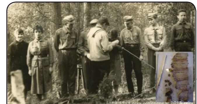
Symboliczne groby powstańców z 1848 r. Zdjęcie z 1958 r.