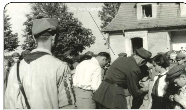
Uroczystość na boisku Szkoły Powszechnej w Puszczykówku

dziłem kwerendę i udało mi się znaleźć w kronice „Obozu Harcerskiego Ośrodka „Puszczyk” w Puszczykowie” zdjęcia wykonane prawdopodobnie podczas uroczystości w dniu 2 listopada 1958 roku. Na trzech zdjęciach wykonanych niewątpliwie na symbolicznych grobach powstańców widać