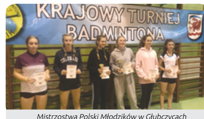
Mistrzostwa Polski Młodzików w Głubczycach

Tydzień później już w szerszym składzie zawodnicy PTS-u wystartowali w Krajowym Turnieju Młodzików Młodszych, Młodzików i Juniorów Młodszych w Miastku.