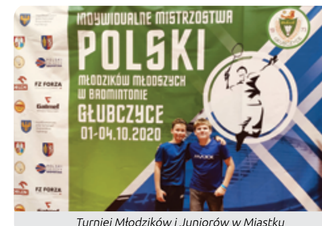
Turniej Młodzików i Juniorów w Miastku