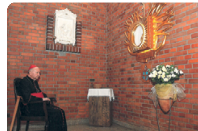
Kard. Marian Jaworski w modlitewnej zadumie przy relikwii św. Jana Pawła II