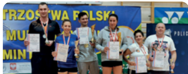
Mistrzostwa Polski Służb Mundurowych