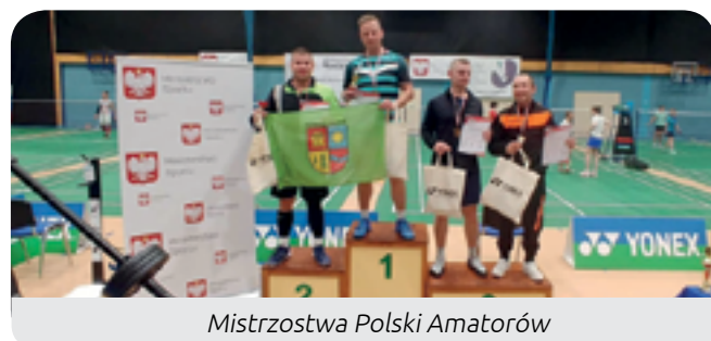
Mistrzostwa Polski Amatorów