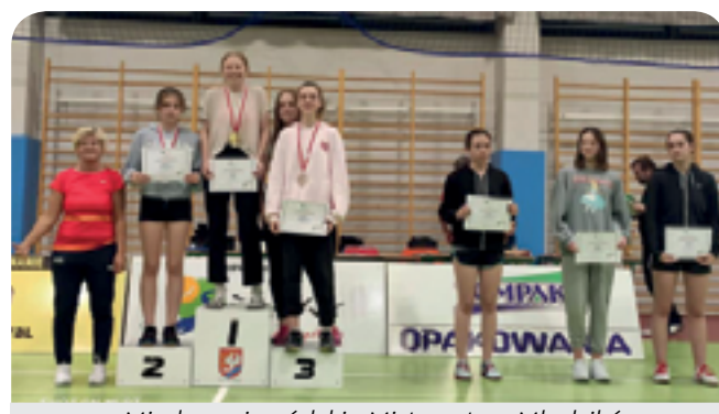
Międzywojewódzkie Mistrzostwa Młodzików i Eliminacje do Ogólnopolskiej Olimpiady Młodzieży