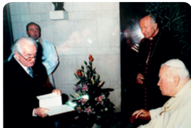
Watykan 18 XI 2002 r. — spotkanie z Ojcem Świętym i przekazanie kroniki budowy kościoła w Puszczykowie.

— 16 października 1994 r. w parafii - Puszczykovo, zostaje poświęcony dzwon im. Jana Pawła II,