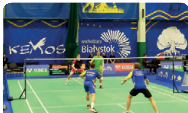
Mistrzostwa Polski Juniorów w Białymstoku