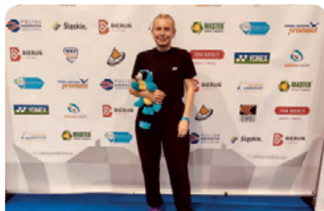
Mistrzostwa Polski Młodzików - Bieruń