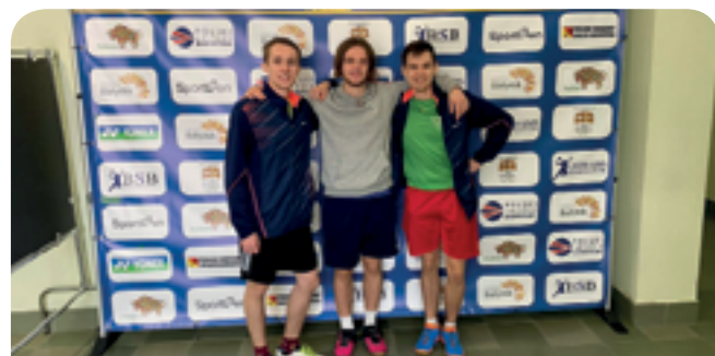
Mistrzostwa Polski Juniorów w Białymstoku