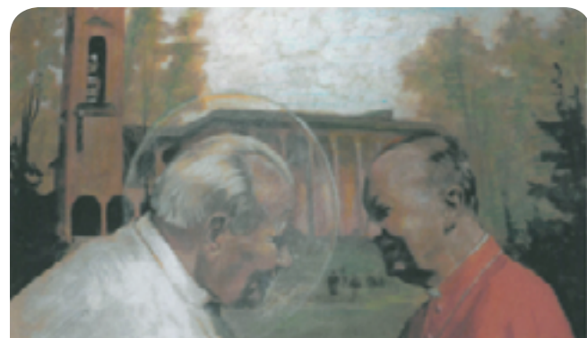
Malarska wizja spotkania „Przyjaciół” w puszczykowskim kościele