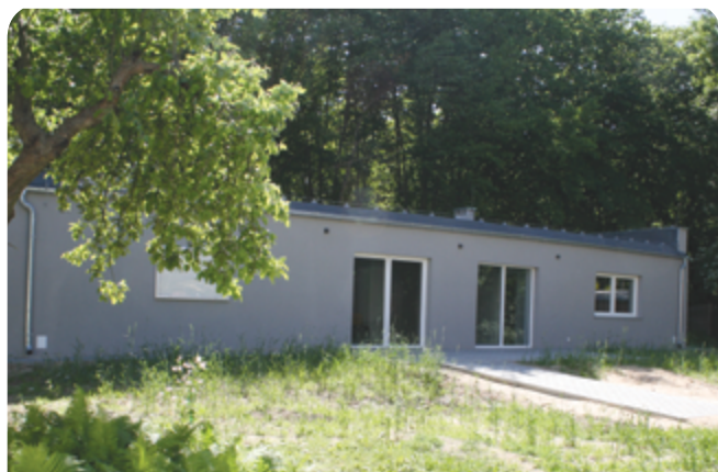
„Harcówka Nasza Miejscówka” zrealizowana w ramach PBO 2018