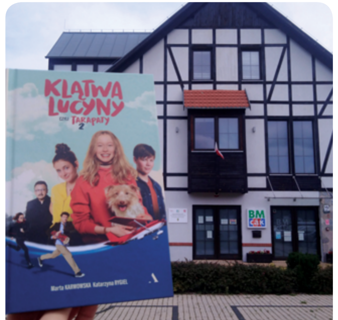
„Kłątwa Lucyny, czyli tarapaty 2”, M. Karwowska, K. Rygiel, il. M. Ruszkowska. Wyd. Agora, Warszawa 2020. Zdjęcie z okładki książki M. Mutor, opracowanie graficzne książki ProDesGraf