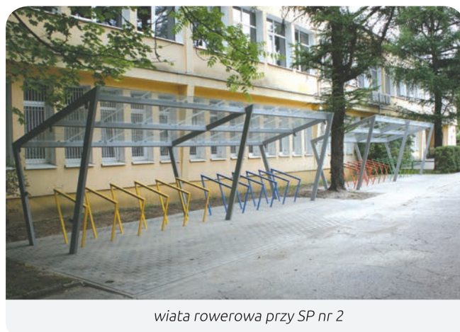
wiata rowerowa przy SP nr 2