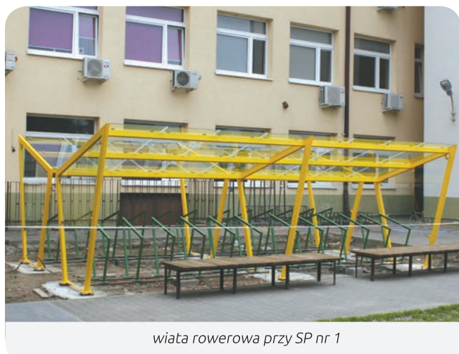
wiata rowerowa przy SP nr 1