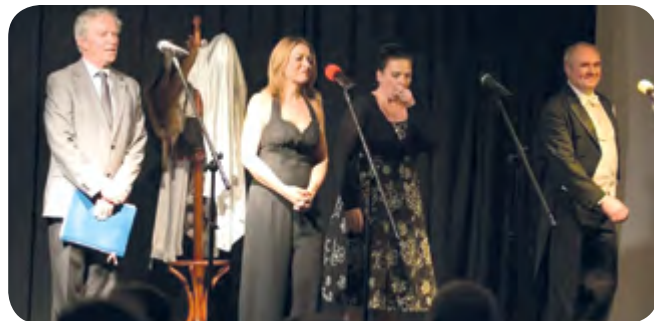
Fot. Ala Brączkowska