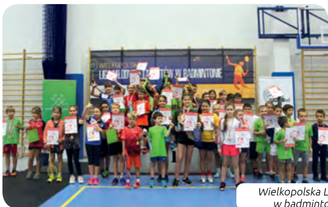
Wielkopolska Liga Młodych Talentów w badmintonie – Puszczykowo