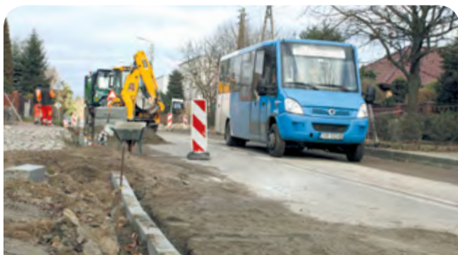
Prace na ul. Sobieskiego.