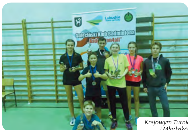
Krajowym Turnieju Juniorów Młodszych i Młodzików w Lubniewicach