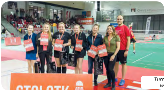
Turniej Stolotka w Gnieźnie