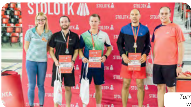
Turniej Stolotka w Gnieźnie