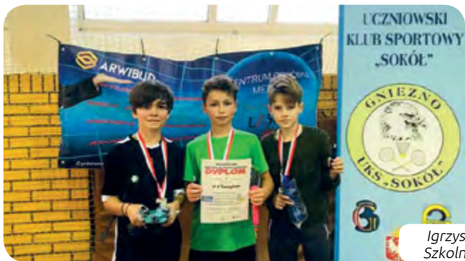
Igrzyska Młodzieży Szkolnej w Gnieźnie