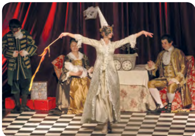
Fot. Ala Brączkowska