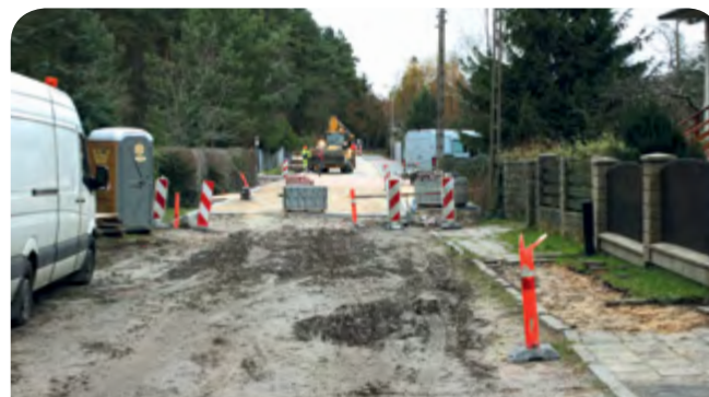
Prace na ul. Mazurskiej.