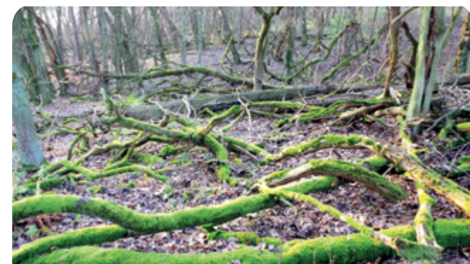
Duże ilości martwego drewna są gwarancją rozwoju kolejnych pokoleń roślin oraz bogactwa form życia.