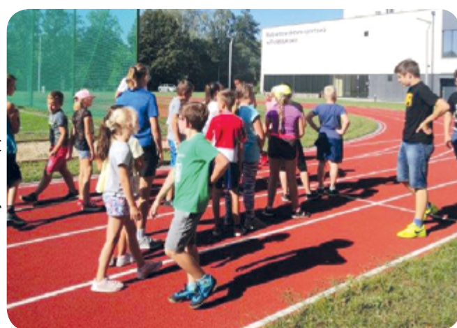
Fot: Joanna Hejnowicz (6)