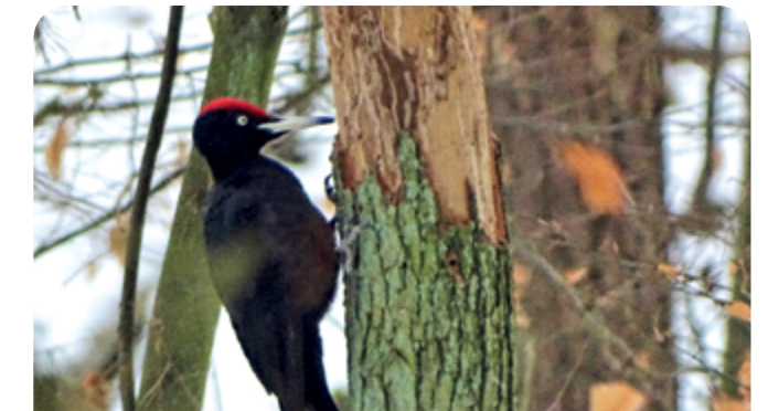
Dzięcioł czarny - największy cieśla wśród ptaków Parku, poszukuje pokarmu w martwym drewnie.