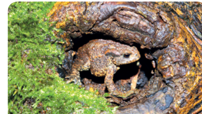
Ropucha szara znajduje w martwym drewnie kryjówkę i zimowisko. (fot. R. Kurczewski)

Zamierające i martwe drewno ma znaczenie również dla zwierząt kręgowych. Drzewa przewracające się do wody, w trakcie swojego rozkładu użyźniają ją, a uwalniające się garbniki mają działanie bakteriobójcze, zakwaszają wodę zapewniając niektórym gatunkom ryb odpowiednie warunki do życia i rozmnażania się. Ryby wśród zatopionych drzew znajdują też doskonałe kryjówki czy miejsca na tarło. Podobnie wielu kręgowcom lądowym martwe drewno zapewnia schronienie, a także pokarm. Płazy, które potrzebują wilgotnego środowiska znajdują tu bardzo dobre warunki do życia. Zwalone pnie są z jednej strony doskonałym miejscem do wygrzewania się dla gadów (jaszczurki czy węże), z drugiej różnorodne zakamarki pozwalają schronić się przed skwarem czy zagrożeniem. Próchno stanowi dla obu tych grup zwierząt bardzo dobre miejsce do zimowania, a popularny w Parku zaskroniec, znajdzie w nim świetne warunki dla inkubacji jaj. Dla ptaków martwe drewno