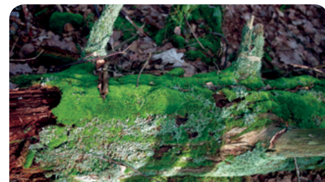
Gęsty „kożuch” mchów i porostów porasta kłodę.

wik zajęczy czy bluszcz kurdybanek, można obserwować mały a nawet gatunki drzewiaste. W miejscach gdzie jest dużo martwego drewna tworzy się dużo bogatszy gatunkowo i urozmaicony krajobrazowo las.