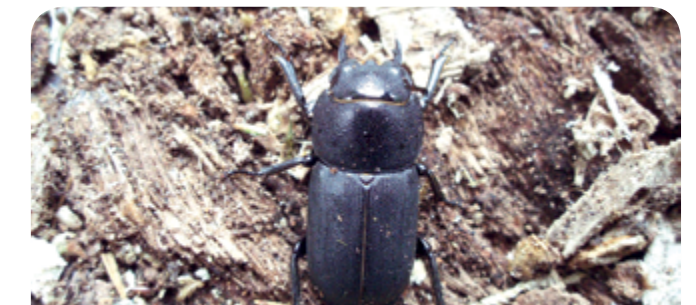
Ciotek matowy – jeden z licznych lokatorów martwego drewna.

Rafał Kurczewski Wielkopolski Park Narodowy