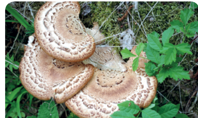
Żagiew tuszkowata – grzyb rosnący najczęściej na drzewach liściastych.

Do roślinnych lokatorów martwego drewna należą przede wszystkim mszaki. Wśród nich można trafić na wiele cennych gatunków. W Wielkopolskim Parku Narodowym, po gradacji brudnicy mniszki w latach 1975-1982, zamarło wiele sosen. W obszarze ochrony ścisłej „Pod Dziadem” pozostawiono posusz, w którym po 15 latach rozkładu stwierdzono 9 różnych zespołów mszaków z kilkudziesięcioma gatunkami, w tym mchy – meszek krzywolistny – jedyne stanowisko w Wielkopolsce i widłoząb tauryjski – ósme stanowisko w Polsce. Wśród roślin naczyniowych nie ma gatunków związanych bezpośrednio z rozkładającym się drewnem. Nie oznacza to jednak, że nie ma ono dla nich żadnego znaczenia. Wiele roślin zakorzenia się bezpośrednio na próchnie tworząc piękne kobierce na kłodach, wyrastając z dziupli czy pni. Poza drobnymi roślinami, jak szcza-