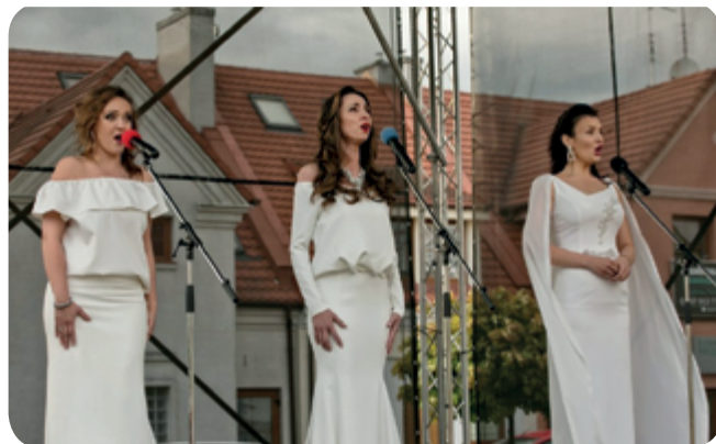
Fot. Ala Brączkowska (4)