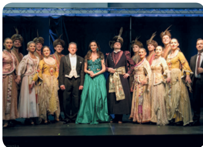
Fot. Ala Brączkowska (4)