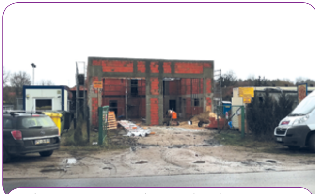
Budowa strażnicy OSP przebiega zgodnie z harmonogramem.