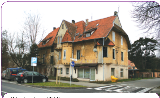
Aktualny stan willi Mimoza.