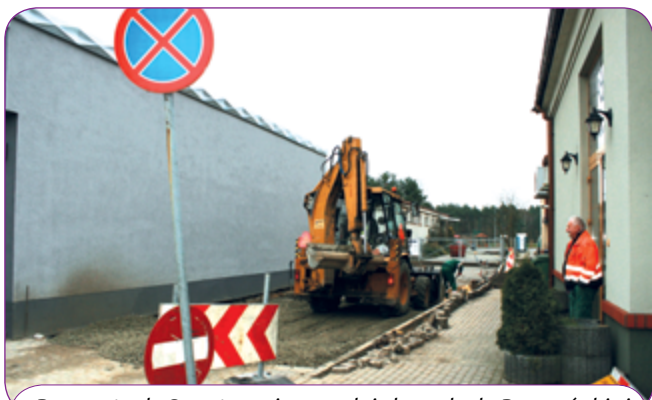
Remont ul. Sportowej, na odcinku od ul. Poznańskiej do zaplecza sklepu Spółem.