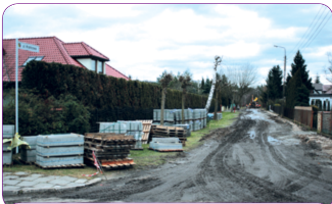
Na ul. Krańcowej rozpoczęły się już prace.