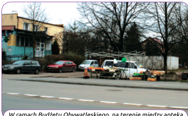
W ramach Budżetu Obywatelskiego, na terenie między apteką, a komisariatem powstanie „zielony rynek”.

WYDAWCA: URZĄD MIEJSKI W PUSZCZYKOWIE; ADRES REDAKCJI: UL. PODLEŚNA 4. Tel. 61 813 32 25, 61 898 37 00, e-mail: um@puszczykowo.pl www.puszczykowo.pl; REDAKTOR NACZELNY: BOGDAN LEWICKI, echo@puszczykowo.pl; WSPÓŁPRACA: AGNIESZKA ZIELIŃSKA-ADAMIAK, MACIEJ DETTLAFF, AGNIESZKA GŁOWACKA-BARTKOWIAK, AGNIESZKA HAHUŁA, JOANNA HEJNOWICZ, JANINA KOZEŃSKA, REMIGIUSZ MOTYCKI, KATARZYNA NOWAK-ŚRONEK, MAGDALENA PŁACHTA, EWA RYBACKA, ALINA STEMPNIAK, KATARZYNA SZYKULSKA, BEATA WITCZAK.