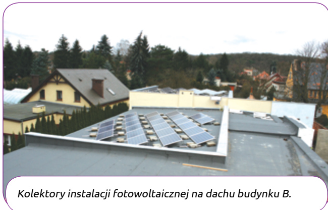
Kolektory instalacji fotowoltaicznej na dachu budynku B.