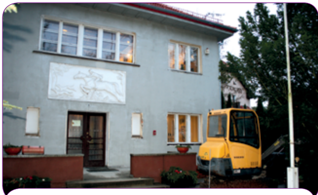
Fronton z płaskorzeźbą amazonki na budynku A UM.