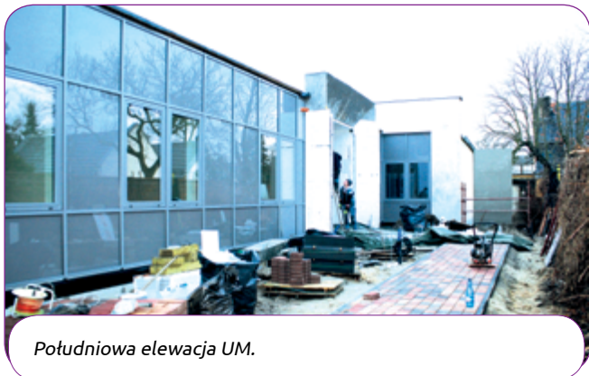
Południowa elewacja UM.