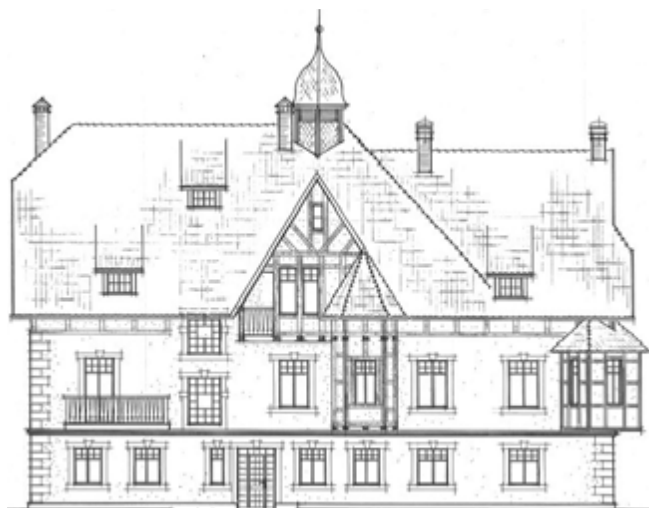
ELEWACJA WSCHODNIA - FRONTOWA