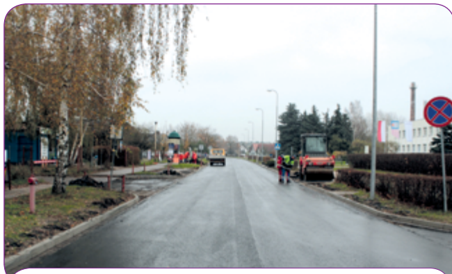
Na początku listopada na ul. Kraszewskiego kończono układanie nowej nakładki bitumicznej.