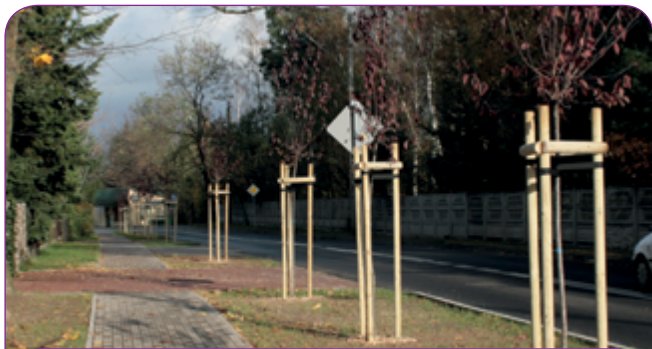
Nowe klony na ul. Piaskowej.