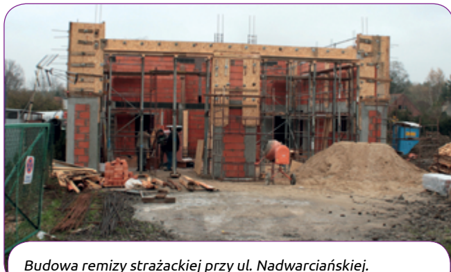
Budowa remizy strażackiej przy ul. Nadwarciańskiej.