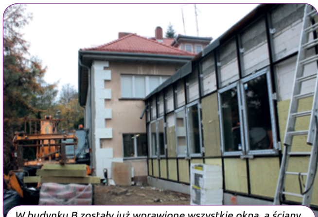
W budynku B zostały już wprawione wszystkie okna, a ściany szczytowe budynku A ocieplone styropianem.

Z termomodernizacją obiektu związane były także prace w tzw. domu nauczyciela przy SP nr 1. W listopadzie wszystkie prace były już zakończone, a budynek odebrany.