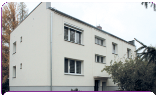
Budynek tzw. domu nauczyciela po termomodernizacji.

WYDAWCA: URZĄD MIEJSKI W PUSZCZYKOWIE; ADRES REDAKCJI: UL. PODLEŚNA 4. Tel. 61 813 32 25, 61 898 37 00, e-mail: um@puszczykowo.pl www.puszczykowo.pl; REDAKTOR NACZELNY: BOGDAN LEWICKI, echo@puszczykowo.pl; WSPÓŁPRACA: AGNIESZKA ZIELIŃSKA-ADAMIAK, MACIEJ DETTLAFF, AGNIESZKA GŁOWACKA-BARTKOWIAK, AGNIESZKA HAHUŁA, JOANNA HEJNOWICZ, JANINA KOZEŃSKA, REMIGIUSZ MOTYCKI, KATARZYNA NOWAK-ŚRONEK, MAGDALENA PŁACHTA, EWA RYBACKA, ALINA STEMPNIAK, KATARZYNA SZYKULSKA, BEATA WITCZAK.