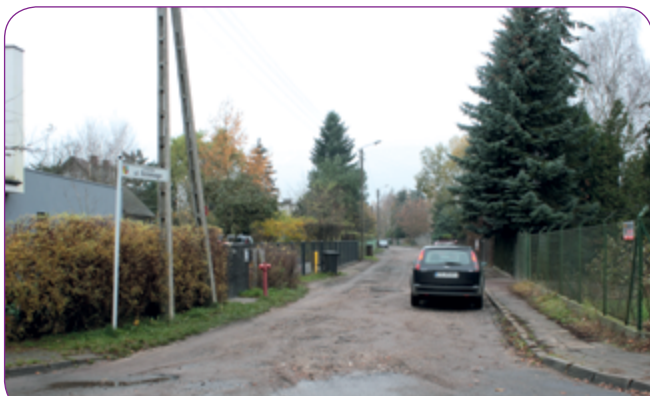
Przetarg na budowę ul. Solskiego jest w trakcie weryfikacji.