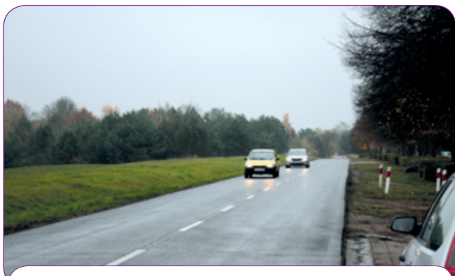
Nowa nakładka bitumiczna na ul. Nadwarciańskiej.