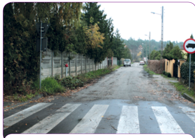
Ulica Strażacka zyska nową nawierzchnię i chodnik.