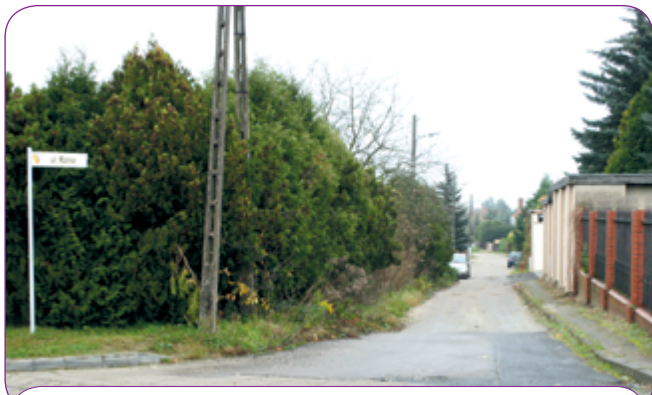
Przetarg na budowę ul. Rolnej będzie musiał być powtórzony.