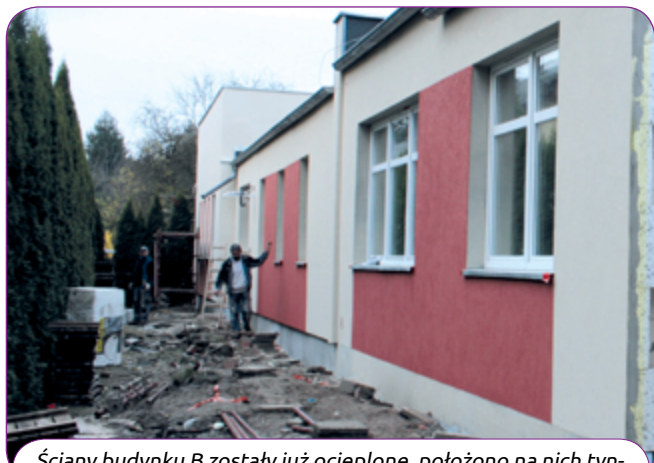
Ściany budynku B zostały już ocieplone, położono na nich tynki i pomalowano.

Przy ul. Nadwarciańskiej budowana jest natomiast remiza strażacka. Na tej budowie prace (stan deweloperski) zostaną zakończone w przyszłym roku. W budynku będą garażowane pojazdy puszczykowskich ochotników oraz przechowywane specjalistyczne wyposażenie, którym dysponuje ta jednostka. Remiza zapewni także zdecydowanie lepsze warunki socjalne.