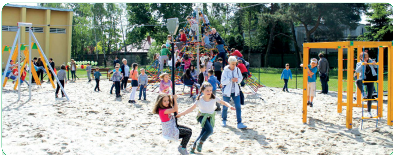
Fantastyczny plac zabaw przy SP nr 2 jest pierwszą inwestycją zrealizowaną w ramach puszczykowskiego budżetu obywatelskiego. Radni na ten cel przeznaczili 100 tys. złotych. Podczas głosowania, na tę propozycję swoje głosy oddało 445 mieszkańców naszego miasta. Jego oficjalne otwarcie odbyło się 25 maja br. i jak doskonale widać na zdjęciu spotkało się z gorącym przyjęciem najmłodszych.