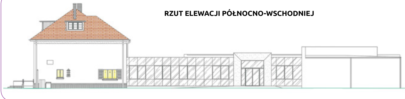
RZUT ELEWACJI PÓŁNOCNO-WSCHODNIEJ