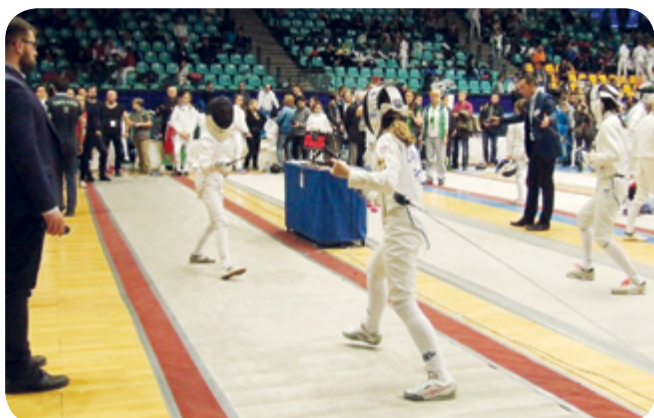
Fot. Monika Palaczyk (3)

W dniach 23-27 marca br. we Wrocławiu odbył się 40 Międzynarodowy Turniej Szermierczy Dzieci Challenge Wratislavia 2017. To największe na świecie tego typu wydarzenie w kategorii dzieci do lat 15. W tym roku do turnieju zgłosiło się ponad 2500 zawodników z 36 państw.