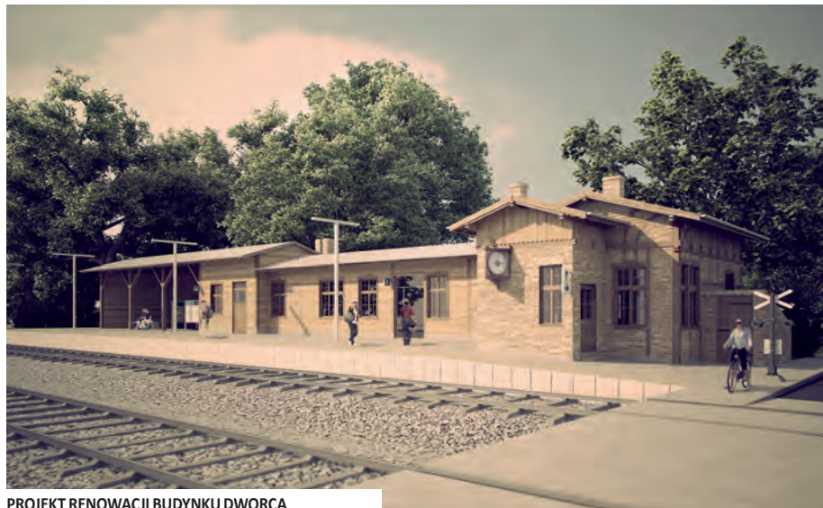
PROJEKT RENOWACJI BUDYNKU DWORCA

W części murowanej zaplanowano reorganizację pomieszczeń, m.in. prze-niesienie toalet do wschodniej części