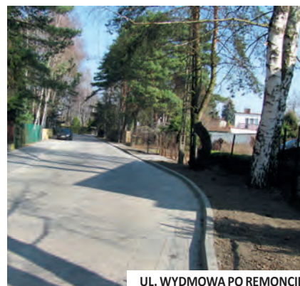
UL. WYDMOWA PO REMONCIE