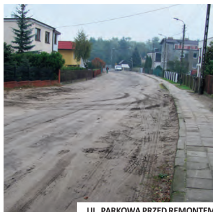
UL. PARKOWA PRZED REMONTEM

Przed budową dróg odbyły się spotkania z mieszkańcami. Większość mieszkających przy ul. Parkowej i Wydmowej opowiedziała się przeciwko budowie progów zwalniających. Natomiast mieszkańcy ul. Jodłowej zadeklarowali wolę zamontowania progów. Ich koszt wyniósł. 3 tys. zł. | LM