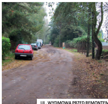
UL. WYDMOWA PRZED REMONTEM