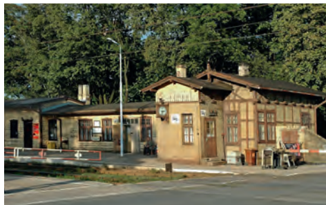
PUSZCZYKOWSKI DWORZEC DZIS