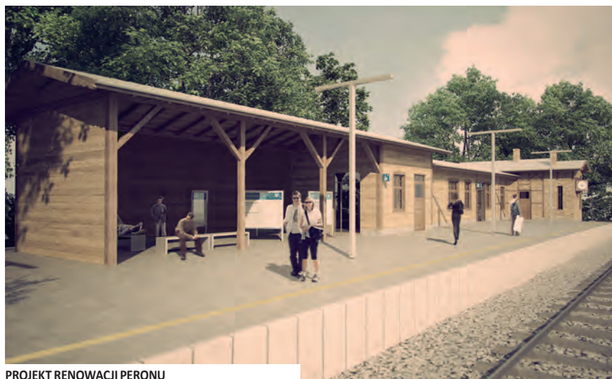
PROJEKT RENOWACJI PERONU

budynku. Umożliwi to połączenie strefy budynku i wyjście z dworca na poczekal-nię letnią. Pracownicy PKP zyskają pokój socjalny, a wyremontowana piwnica speł-ni funkcję pomieszczenia gospodarczego.