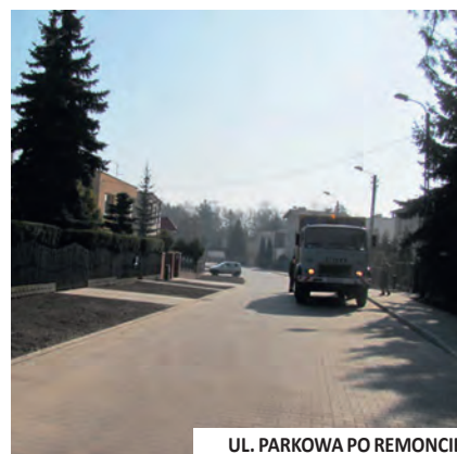
UL. PARKOWA PO REMONCIE