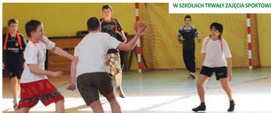
W SZKOŁACH TRWAŁY ZAJĘCIA SPORTOWE

Tak jak w ub. roku warsztaty cieszyły się dużym zainteresowaniem dzieci i młodzie-