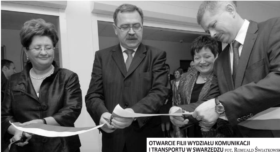
OTWARCIE FILII WYDZIAŁU KOMUNIKACJI I TRANSPORTU W SWARZĘDZU FOT. ROMUALD ŚWIĄTKOWSKI

☞ | Powiat poznański jest jednym z nielicznych, w których funkcjonują filie Wydziału Komunikacji i Transportu. Działają one w Kostrzynie Wlkp., Mosinie, Murowanej Goślinie, Pobiedziskach, Stęszewie, a od 5 lutego także w Swarzędzu.