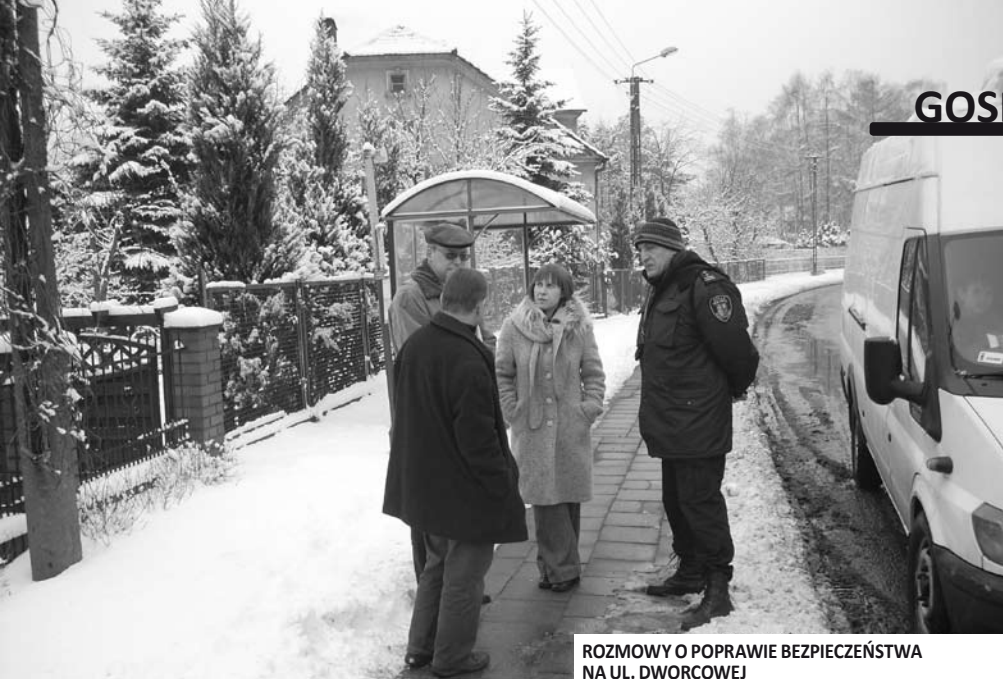
ROZMOWY O POPRAWIE BEZPIECZEŃSTWA NA UL. DWORCOWEJ

słupków przy chodniku od strony krawężdzi jezdni, a także zamontowanie ewentualnej sygnalizacji świetlnej przy przejściu dla pieszych.