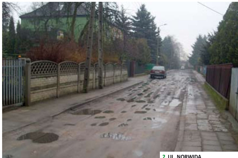
2. UL. NORWIDA