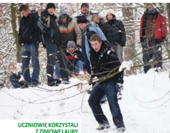
UCZNIOWIE KORZYSTALI Z ZIMOWEJ AURY