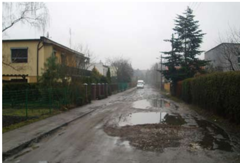
4. UL. JODŁOWA