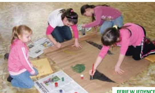
FERIE W JEDYNCE