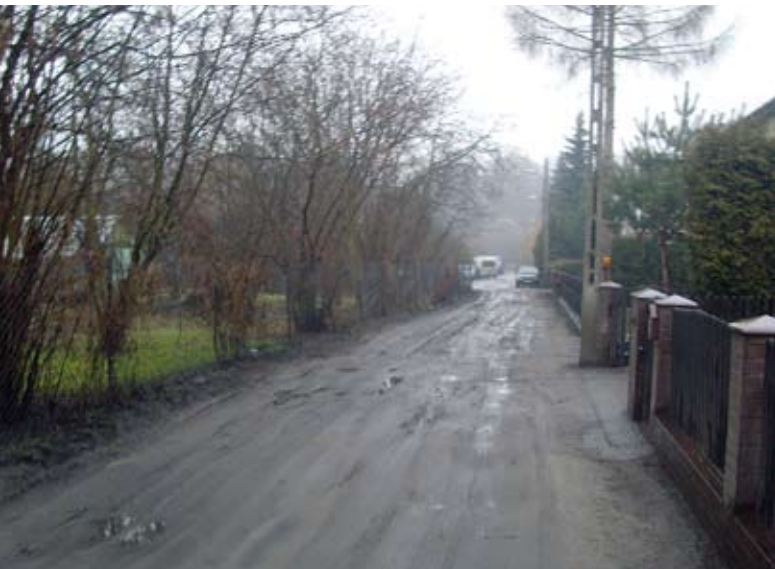
1. UL. ROBOCZA