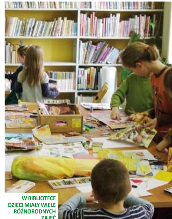
W BIBLIOTECIE DZIECI MIAŁY WIELE RÓŻNORODNYCH ZAJĘĆ