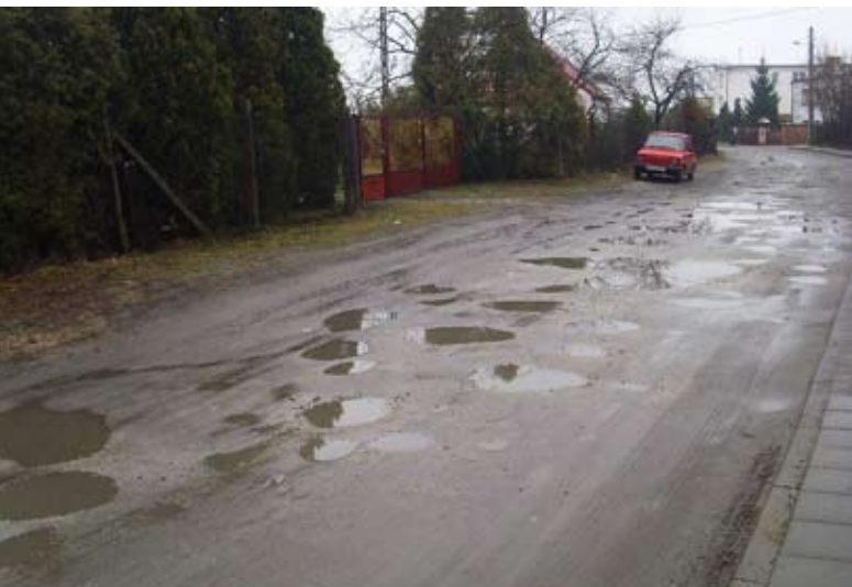
3. UL. GOŁĘBIA