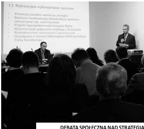
DEBATA SPOŁECZNA NAD STRATEGIĄ

☞ | Rada Miasta uchwaliła Strategię Rozwiązywania Problemów Społecznych Puszczykowa na lata 2009-2015. Dokument przyjęto na sesji 24 czerwca.