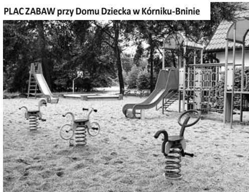
PLAC ZABAW przy Domu Dziecka w Kórniku-Bnlinie