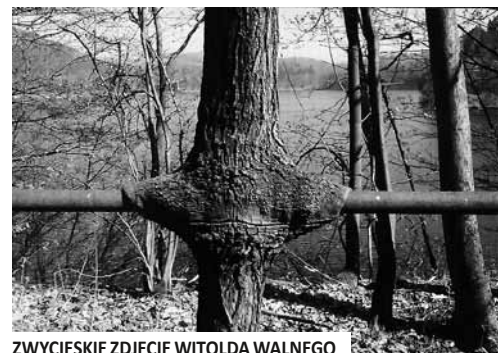
ZWYCIĘSKIE ZDJĘCIE WITOLDA WALNEGO