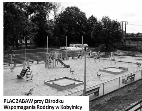
PLAC ZABAW przy Ośrodku Wspomagania Rodziny w Kobylnicy

☞ | Od 1 lipca 2009 r. Starosta Poznański zaprasza dzieci i młodzież do 18. roku życia na bezpłatne zajęcia sportowo-rekreacyjne, które będą realizowane w dziewięciu strefach rekreacji dziecięcej, co tydzień od poniedziałku do soboty przez okres wakacji.