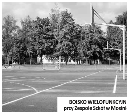
BOISKO WIELOFUNKCYJNE przy Zespole Szkół w Mosinie