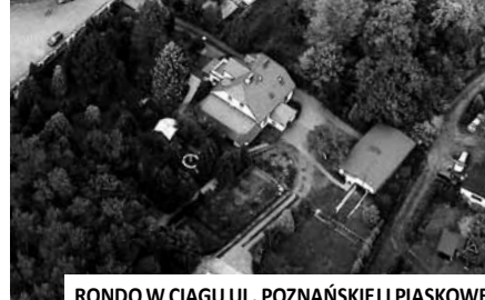
RONDO W CIĄGU UL. POZNAŃSKIEJ I PIASKOWEJ

ro w okolicy rynku i łączy ulice ks. Ignacego Posadzego i Kościelną ze zmodernizowaną ulicą Poznańską. Drugie, zlokalizowane w okolicach cmentarza, w sąsiedztwie kwaciarni, łączy zakończenie ulicy Poznańskiej z ulicą Piaskową.