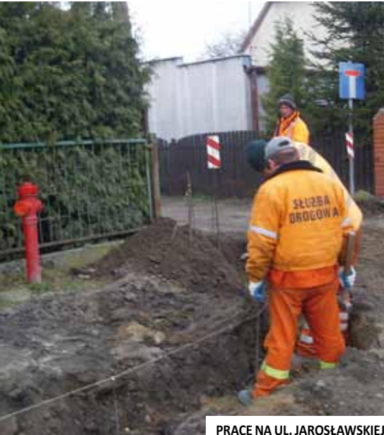
PRACE NA UL. JAROSŁAWSKIEJ

☎ | Jesienią ubiegłego roku rozpoczęto prace związane z budową ulic Jarosławskiej oraz Różanej. Z uwagi na okres zimowy konieczne było przetrwania prac. W chwili obecnej ekipy