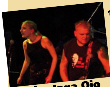
Baba Jaga Ojo

Zapraszamy na świetny spacer-zabawę! Wyruszamy z zatoczki przy ul. Lipowej do ronda przy sklepie Arturo. Później zapraszamy wszystkich na skwer przy ul. Poznańskiej pomiędzy Apteką a budynkiem Komisariatu Policji na ognisko oraz kiermasz rzemiosła artystycznego!