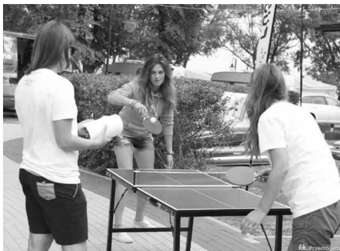
Fot. (9X) Przemysław Janaszek