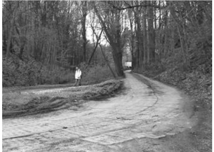
W Puszczykowie jest ona dopiero po drugiej stronie ul. Wysokiej. red

W przypadku II etapu budowy ul. Krętej projektant zdecydował się zastosować do odprowadzenia wód deszczowych system rozsączający. Polega on na tym, że deszczówka z ulicy będzie odbierana przez studzienki i grawitacyjnie, rurami kanalizacyjnymi spłynie w dół, gdzie przed ul. Brata J. Zapłaty, pod ziemią, będą usytuowane bloki rozsączające (wcześniej deszczówka zostanie jeszcze podczyszczona w specjalnych separatorach). Z bloków rozsączających woda bardzo powoli będzie przedostawała się (rozsączała) z powrotem do gruntu. Tego typu rozwiązania stosuje się, kiedy nie ma możliwości podłączenia do istniejącej kanalizacji deszczowej.