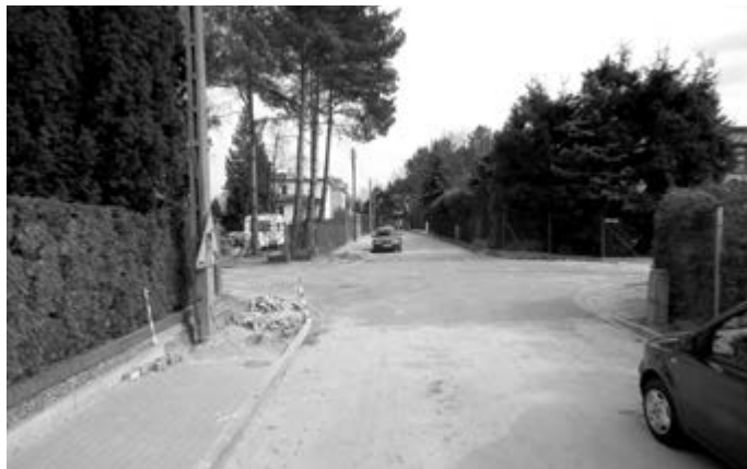
w ulicy Bałtyckiej będzie podłączona kanalizacja z ul. Grunwaldzkiej. red

Natomiast ul. Bałtycka, jest przebudowywana na dłuższym, bo ok. 430 m. odcinku. Także na tej ulicy oraz chodniku biegnącym wzdłuż niej położona jest nawierzchnia z kostki typu pozbruk. Zakres prac przewiduje także wykonanie studzienek wpustowych, które zostaną połączone z projektowaną kanalizacją deszczową. Docelowo do systemu kanalizacji deszczowej