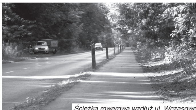
Ścieżka rowerowa wzdłuż ul. Wczasowej