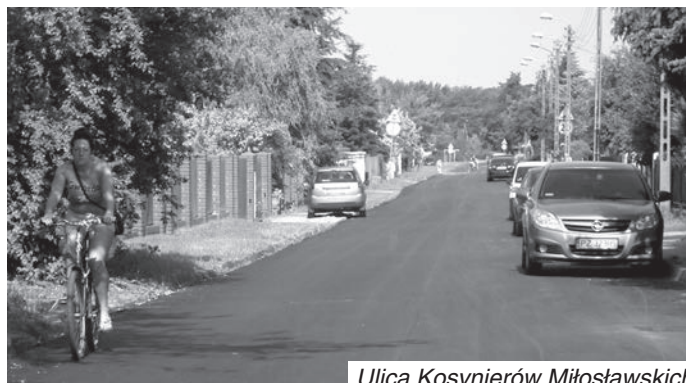
Ulica Kosynierów Miłosławskich