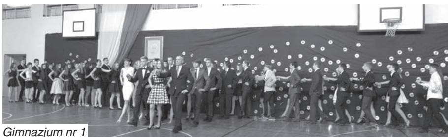
Gimnazjum nr 1