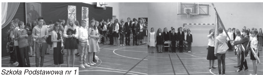
Szkoła Podstawowa nr 1

Trzecioklasiści z Gimnazjum nr 1 tradycyjnie za wyniki w nauce nagradzani są statuetkami „Albercika”. W tym roku szkolna społeczność przyznała też Honorową Statuetkę Albercika Burmistrzowi Andrzejowi Balcerkowi, za jak napisano na dyplomie „ogrom wkładu w rozwój Gimnazjum nr 1 w Puszczykowie im. Alberta Einsteina oraz w szczególności za rozumienie potrzeb młodego pokolenia”.