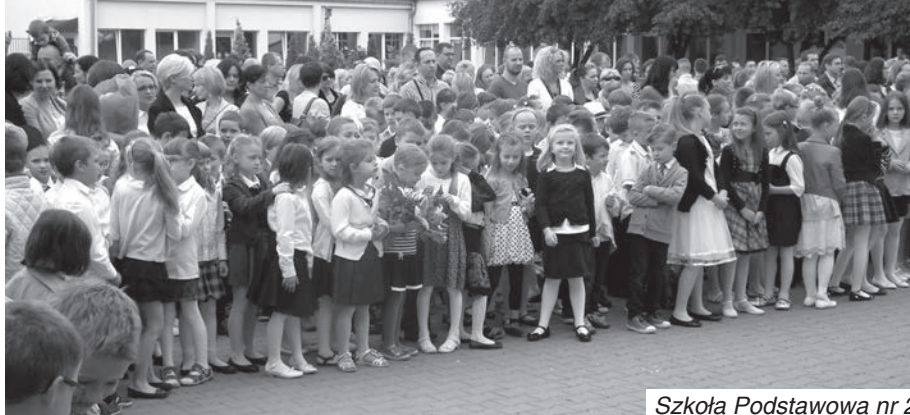
Szkoła Podstawowa nr 2