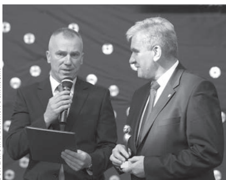
Wręczenie Honorowej Statuetki Albercika