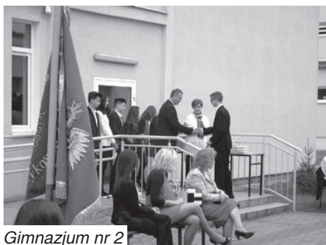
Gimnazjum nr 2