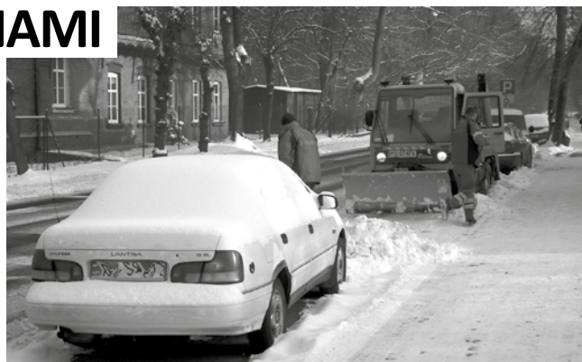
Tak zaparkowane samochody uniemożliwiają należyte odśnieżanie

Chociaż na razie za oknami śniegu nie widać, kiedy spadnie będziemy musieli zadbać o ich odśnieżenie chodników. Ten obowiązek spoczywa bowiem na właścicielach posesji, do których przylega chodnik. Przepisy precyzują, że także w okresie zimowym trotuar musi być utrzymywany w należytym stanie. Za nieodśnieżony chodnik możemy zapłacić