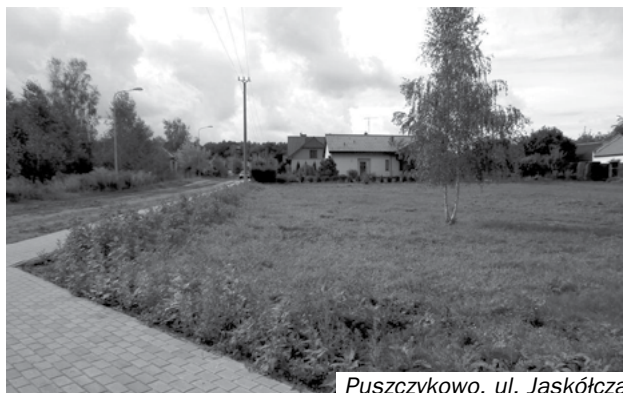
Puszczykowo, ul. Jaskółcza

Przeznaczenie w miejscowym planie zagospodarowania przestrzennego – pod zabudowę mieszkaniową jednorodzinną, oznaczoną symbolem Mj – uchwała Rady Miasta Puszczykowa Nr 118/04/IV z dnia 7.09.2004 r., ogłoszona w Dzienniku Urzędowym Województwa Wlkp. z 4.10.2004 r. Nr 144 Poz. 2992.