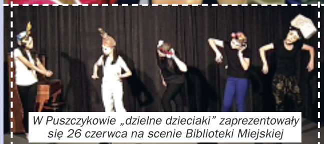
W Puszczykowie „dzielne dzieciaki” zaprezentowały się 26 czerwca na scenie Biblioteki Miejskiej