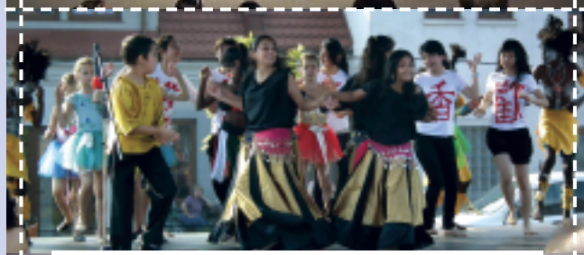
Drugi raz żywiłowe występy podziwialiśmy 6 lipca na puszczykowskim Rynku