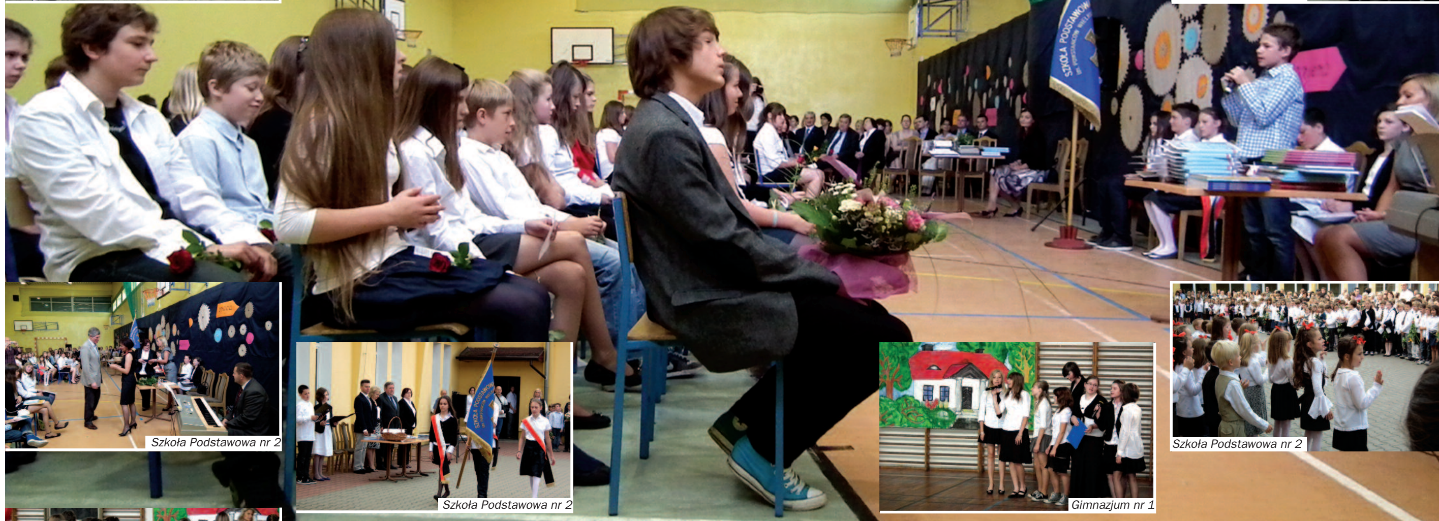
Szkoła Podstawowa nr 2