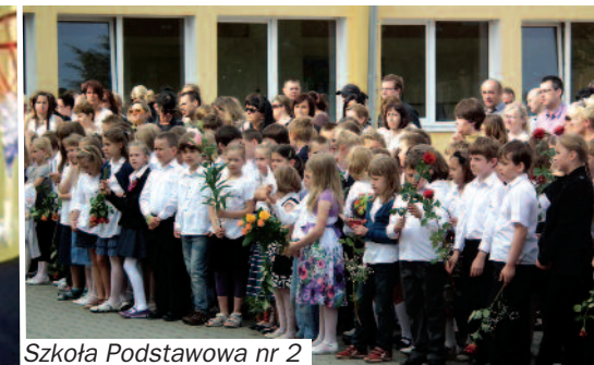
Szkoła Podstawowa nr 2