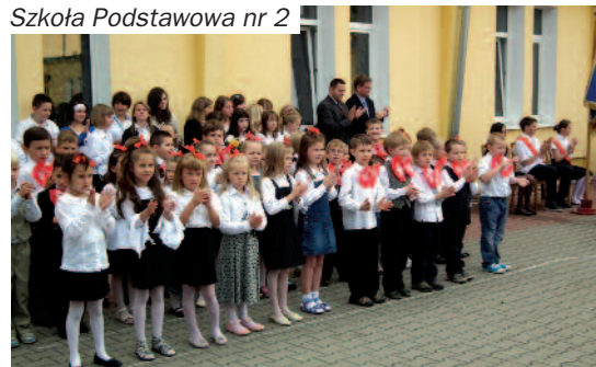
Szkoła Podstawowa nr 2