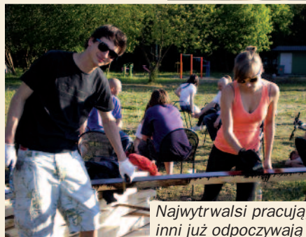
Najwytrwalsi pracują, inni już odpoczywają