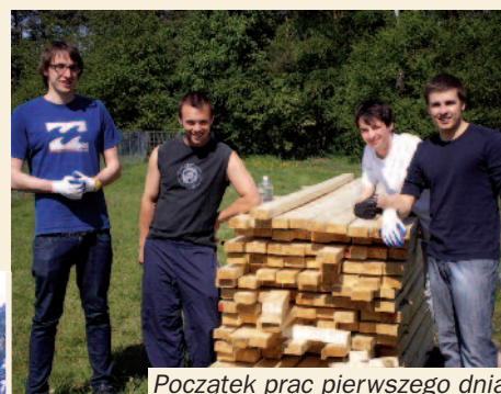
Początek prac pierwszego dnia

6 i 7 maja br. na terenie Centrum Animacji Sportu młodzież z Puszczykowa wykonywała społecznie ławki do trybun. Poniżej prezentujemy zdjęcia z prac.