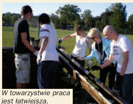
W towarzystwie praca jest łatwiejsza.

6 i 7 maja br. na terenie Centrum Animacji Sportu młodzież z Puszczykowa wykonywała społecznie ławki do trybun. Poniżej prezentujemy zdjęcia z prac.