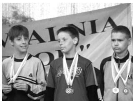
Uroczyste wręczenie medali