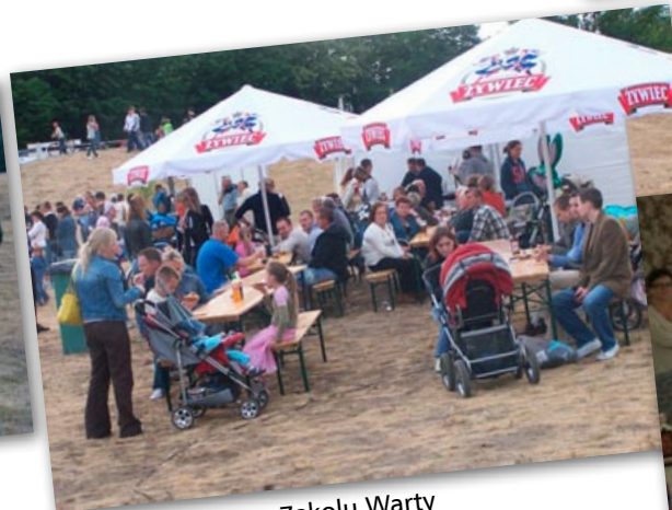
Ogródek piwny na Zakolu Warty