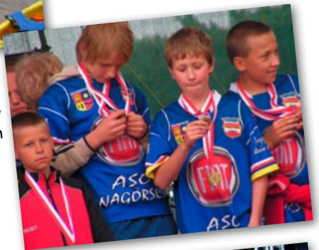
Zwycięzcy turniejów sportowych