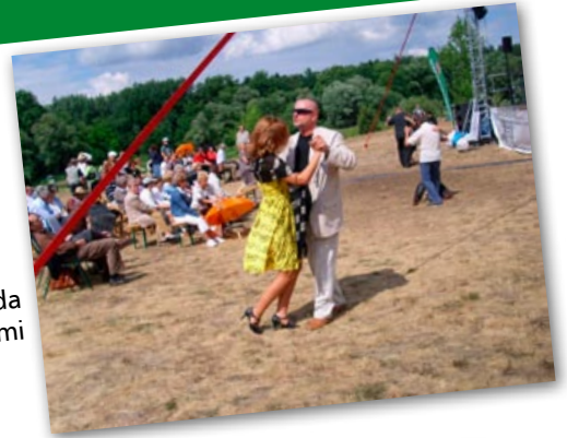
Biesiada z tańcami