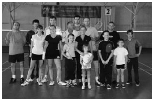
Uczestnicy Turnieju w Badmintonie