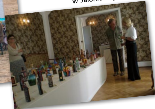
Wernisaż wystawy pani Zięby w Salonie artystycznym