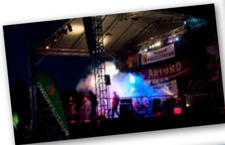
Koncerty puszczykowskich zespołów młodzieżowych