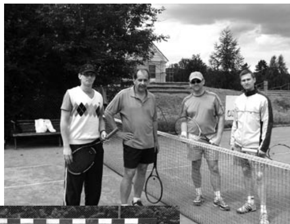
Finaliści Zawodów Tenisa Ziemnego Seniorów