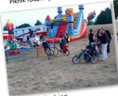
Plac zabaw dla dzieci