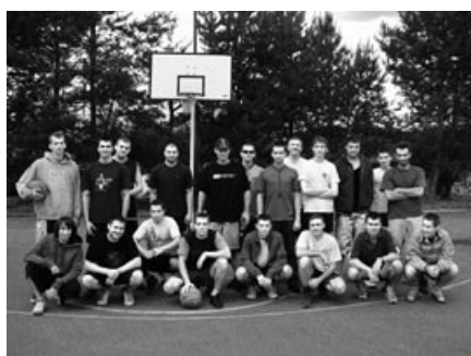
Zwycięzcy Zawodów Piłki Koszykowej