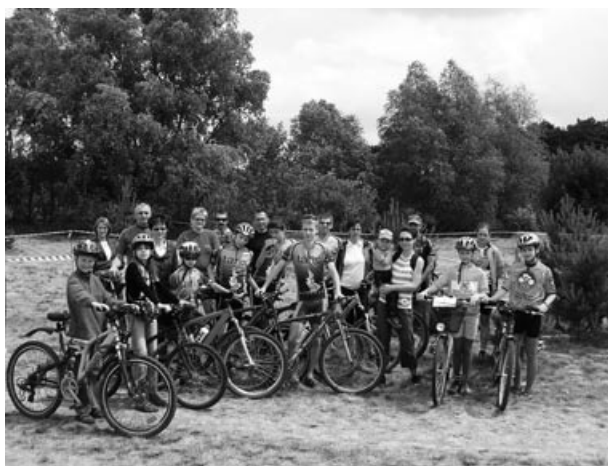
Zwycięzcy Wyciągu w Kolarstwie Górskim