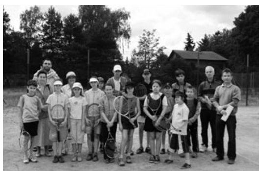
Uczestnicy Turnieju Tenisa Ziemnego Szkół Podstawowych i Gimnazjalnych