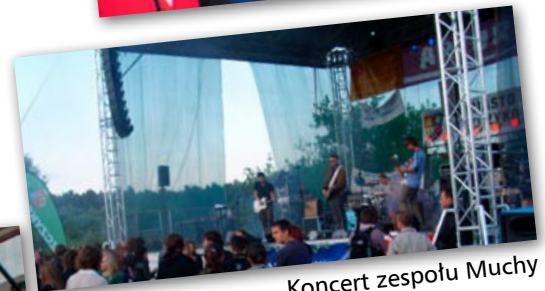
Koncert zespołu Muchy