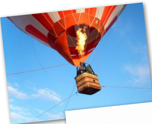
Lot balonem nad Puszczkowiec