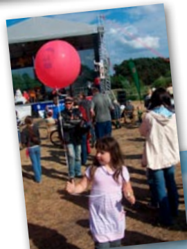
Piknik rodzinny na Zakolu Warty