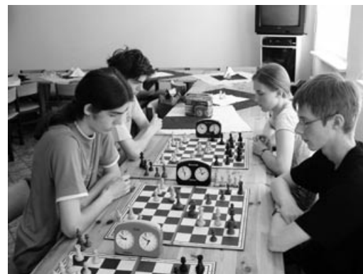
Finaliści Turnieju Szachowego