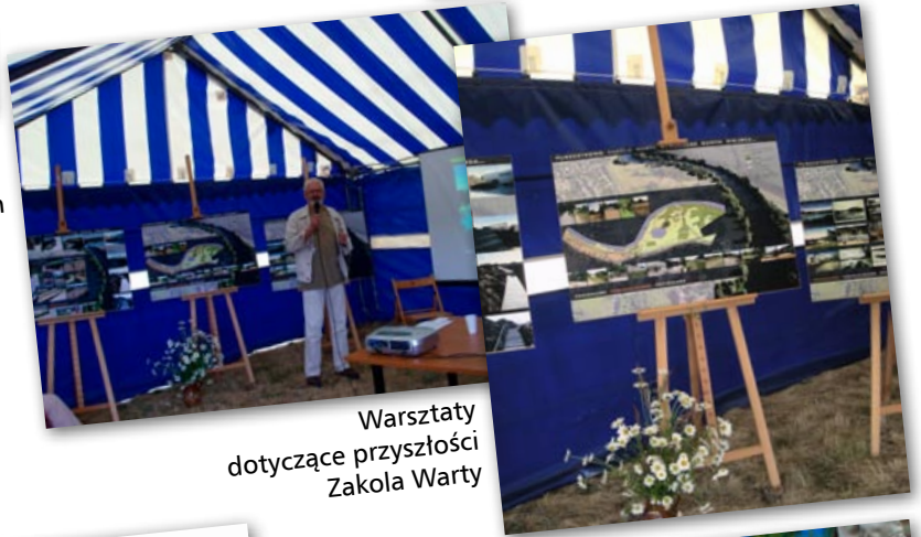
Warsztaty dotyczące przyszłości Zakola Warty