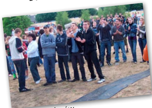
Brawa dla kolegów