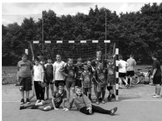
Finaliści Memoriału im. Jerzego Gołbiowskiego