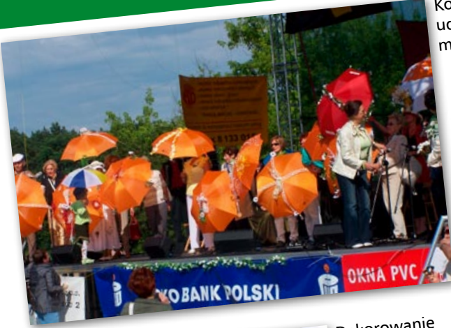
Konkurs na najpiękniej udekorowany margaretkowy parasol