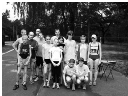
Zwycięzcy Biegu Ulicznego