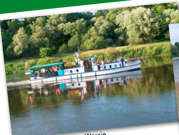
Rejs statkiem Bajka po Warcie