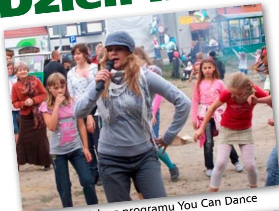
Agata Bogońska z programu You Can Dance z dziećmi na skwerze