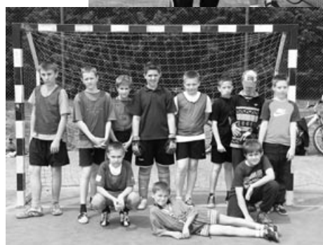
Zwycięzcy Turnieju Puszczkowskiej Ligi Piłki Nożnej