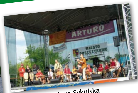
Jambe Fola z Ewą Sykulską i uczestnikami warsztatów bębniarskich