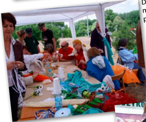
Dekorowanie margaretkowych parasoli