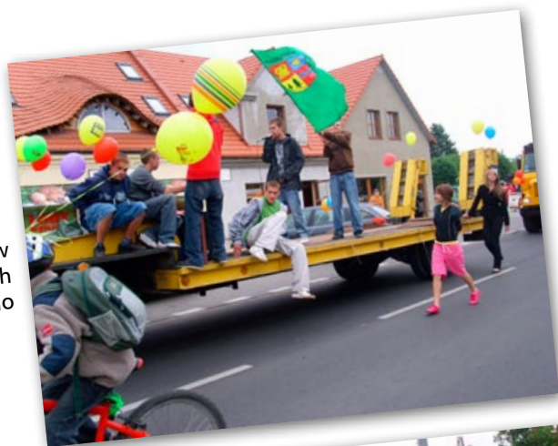
Występ zespołów hip-hopowych PeZetPe Korollo