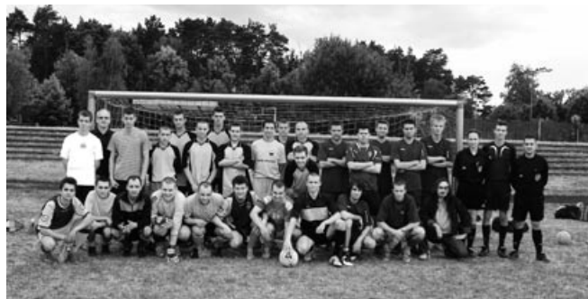
Finaliści Turnieju Piłki Nożnej Zespołów Niezrzeszonych