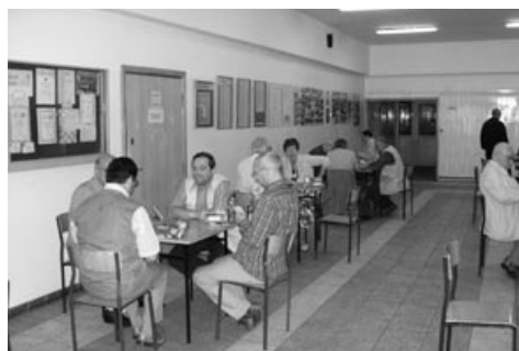
Zawody Brydża Sportowego